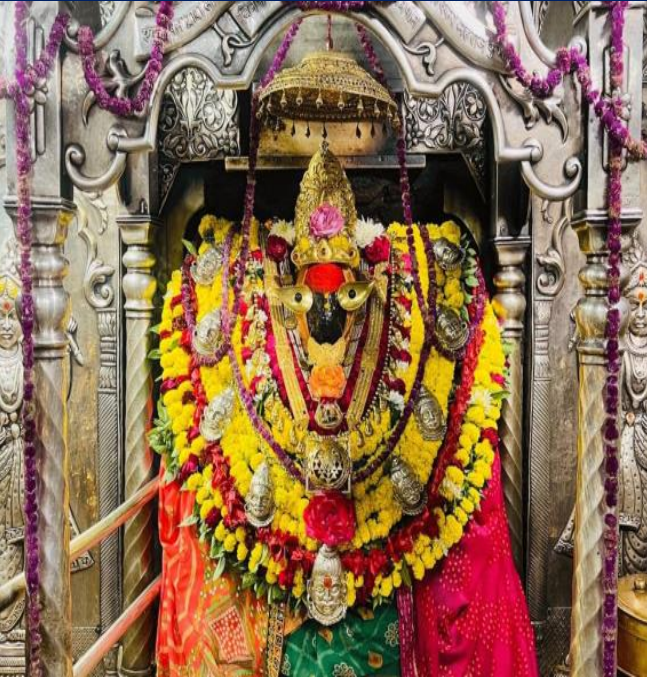
माँ विंध्यवासिनी, विंध्यचल